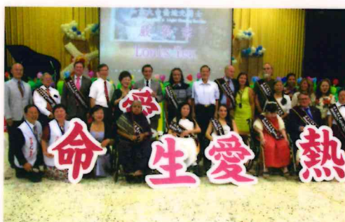
2018年全球熱愛生命獎章得主會師活動。