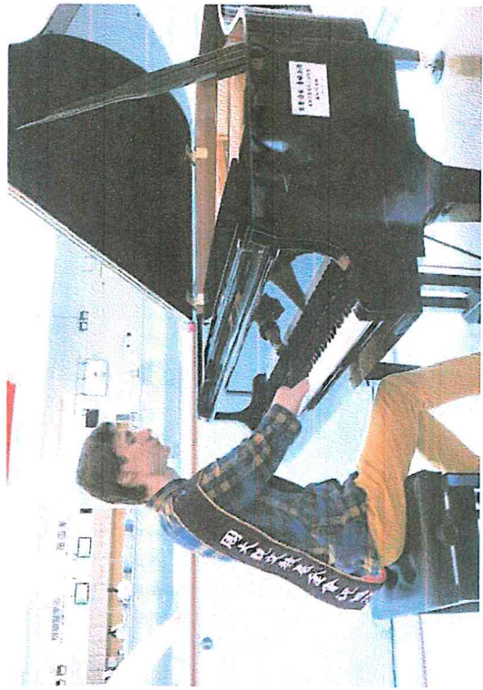
↑ 俄羅斯無聲鋼琴勇士羅曼諾夫，昨日在陽大宜爾醫院演出，動人的曲音讓在場人士驚呼連連。