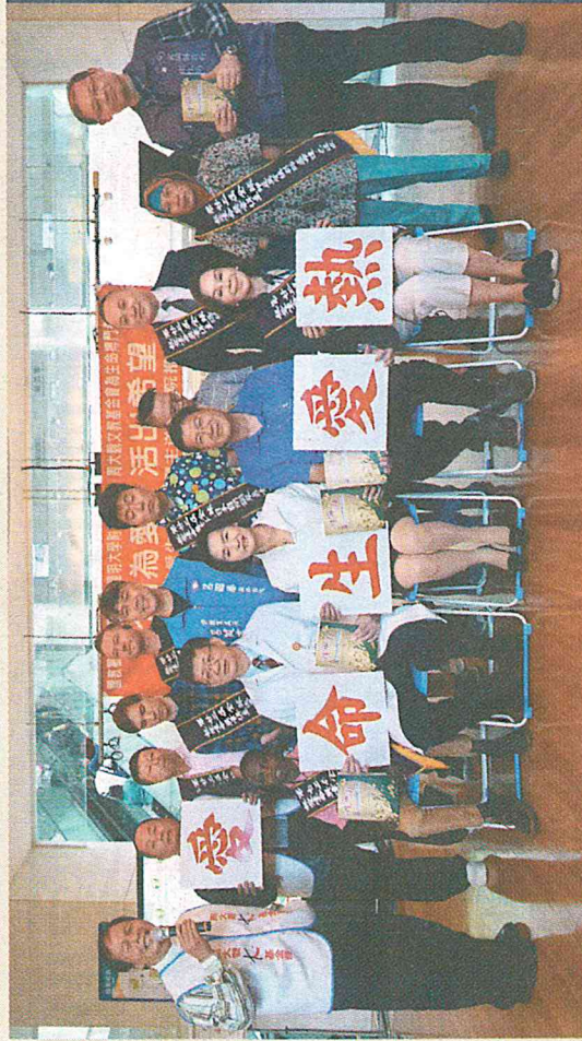
周大觀文教基金會與全球熱愛生命獎章得主昨赴陽明大學附設宜蘭醫院，並贈病友《生命力》一書，盼更多人能化病為愛，活出希望。

然身患殘疾，卻不給自己設限，用無掌的手彈出奇蹟，以優美的琴聲打動人心，他不只抱回一個國際大獎，還到各國回饋義演，也成為勇敢追夢的表率。